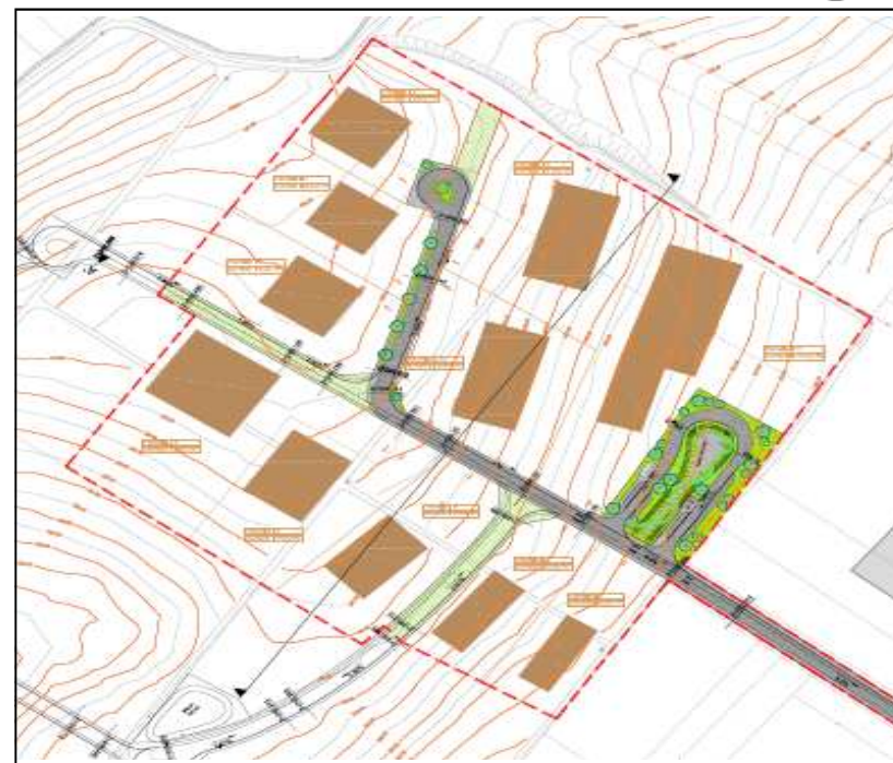
Zone d'activités « Les Plantes » à Marnay Zone d'hypothèse d'implantation du bâti pour la phase 1